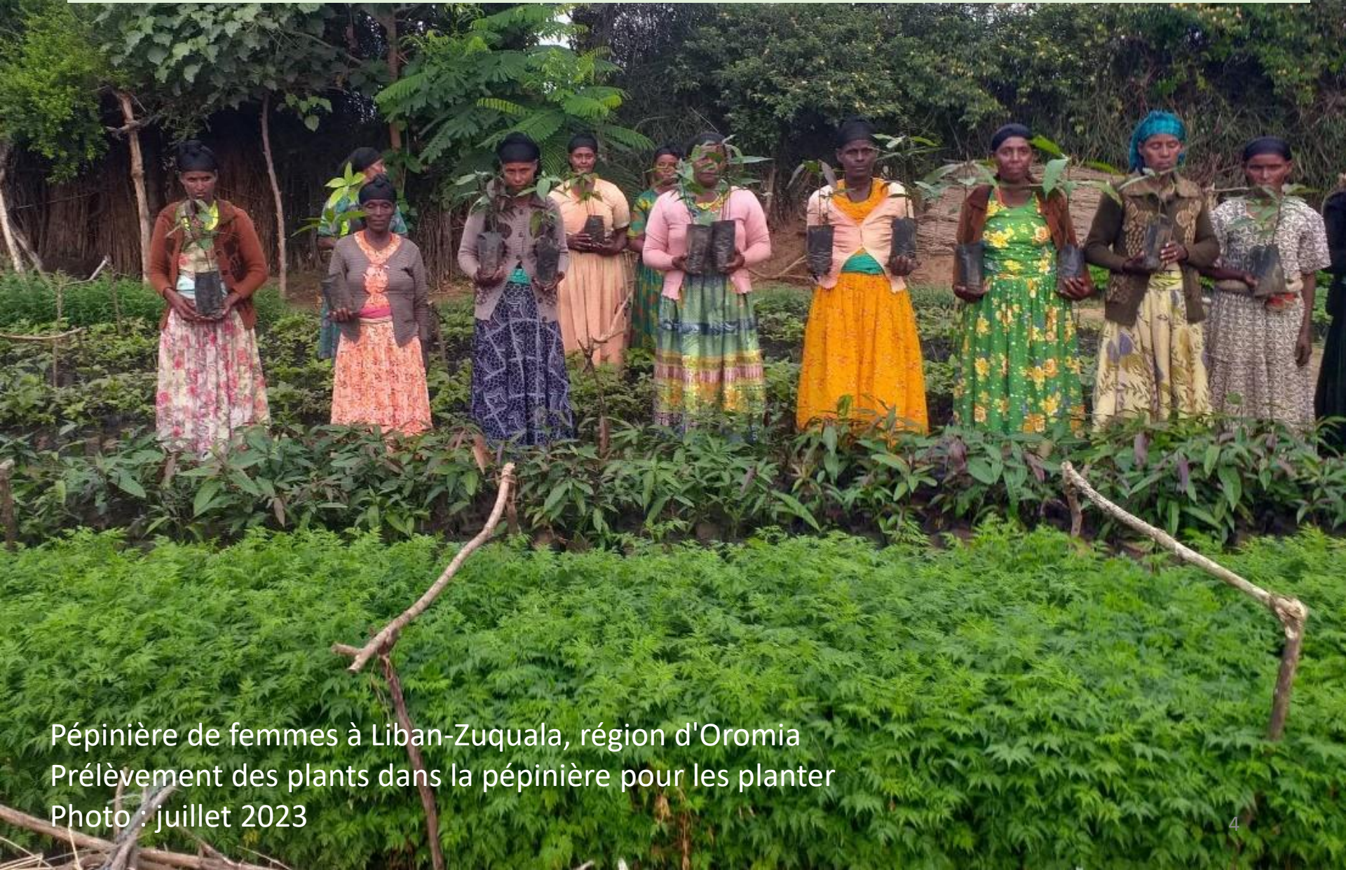
Pépinière de femmes à Liban-Zuquala, région d'Oromia Prélèvement des plants dans la pépinière pour les planter Photo : juillet 2023

Dans de nombreuses pépinières, plus de 10 millions plants ont été produits - principalement par des femmes.