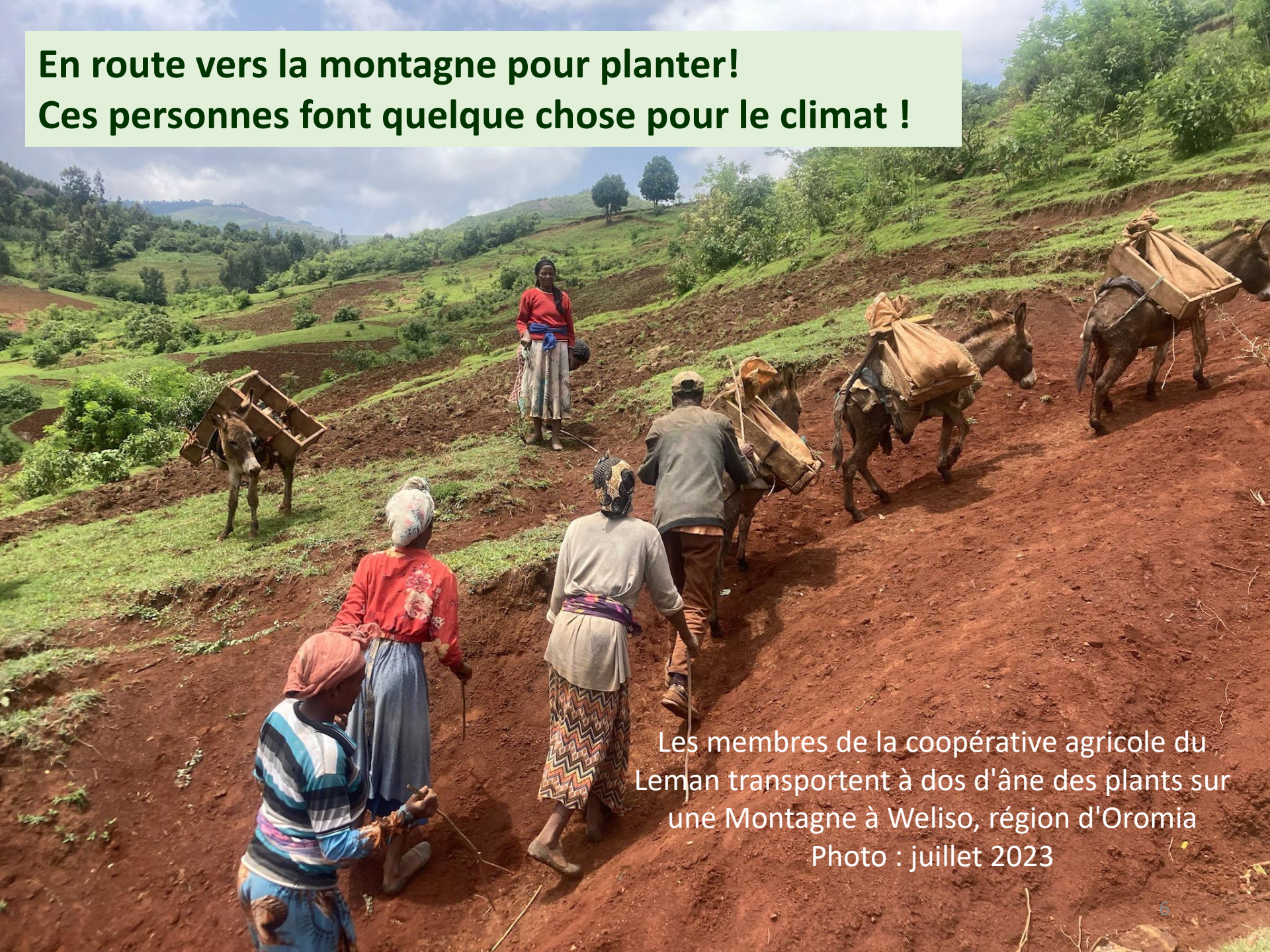
Les membres de la coopérative agricole du Lemman transportent à dos d'âne des plants sur une Montagne à Weliso, région d'Oromia Photo : juillet 2023